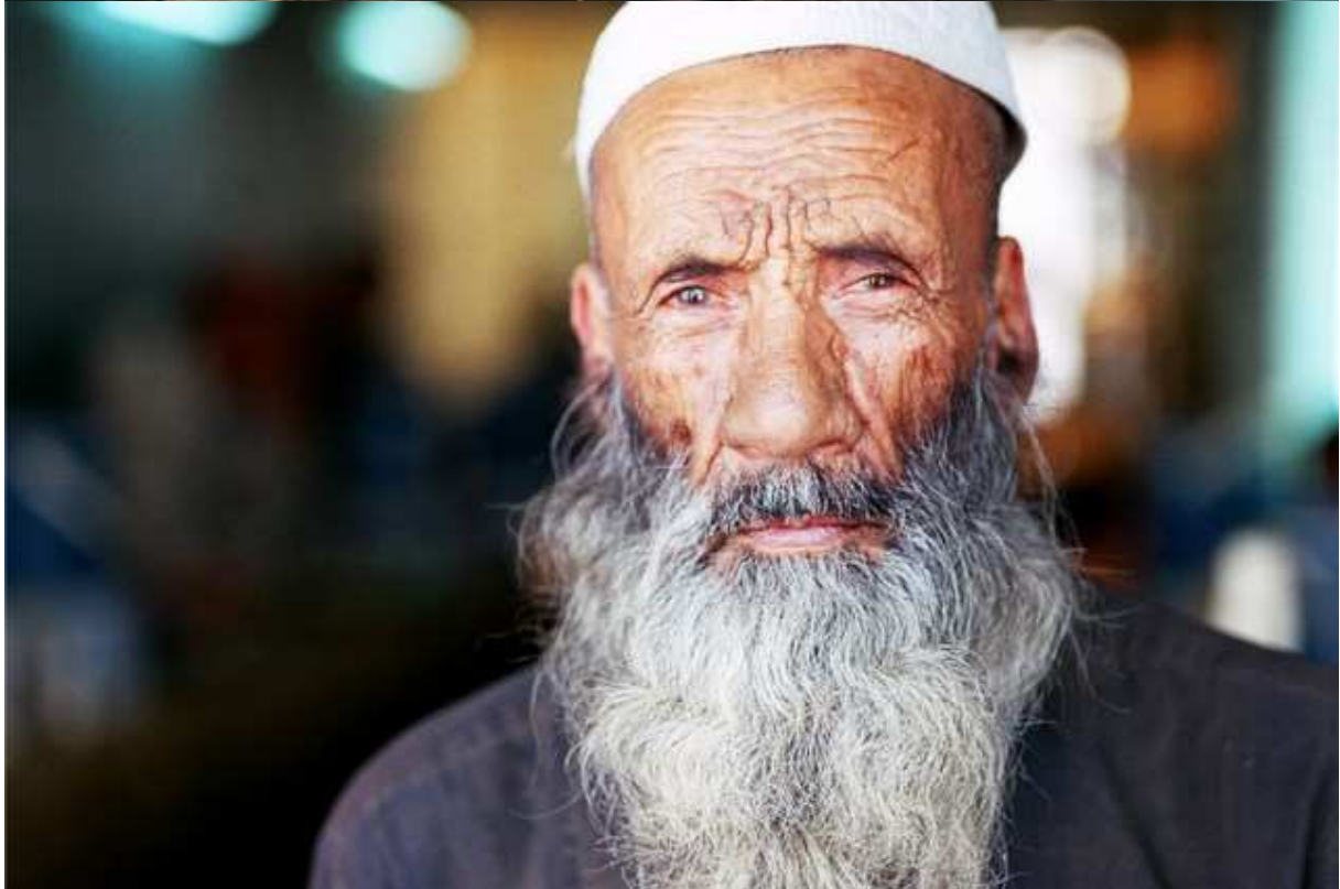
Chaikhana-restaurant de kebab, Hérat