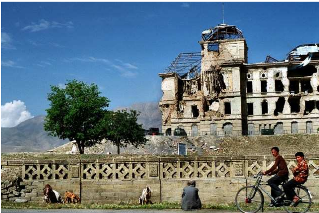
Vieux berger assis devant Darlaman, l'ancien palais présidentiel occupé par l'armée canadienne, Kaboul.