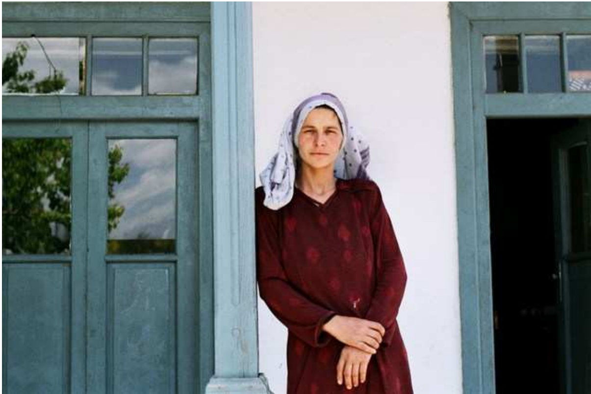
Cour intérieure d'une vieille maison de Kaboul, quartier de Darlaman. Cette jeune femme est domestique et vit dans plusieurs pièces en terre battue avec ses cinq enfants, son mari et ses parents, sans sanitaires.