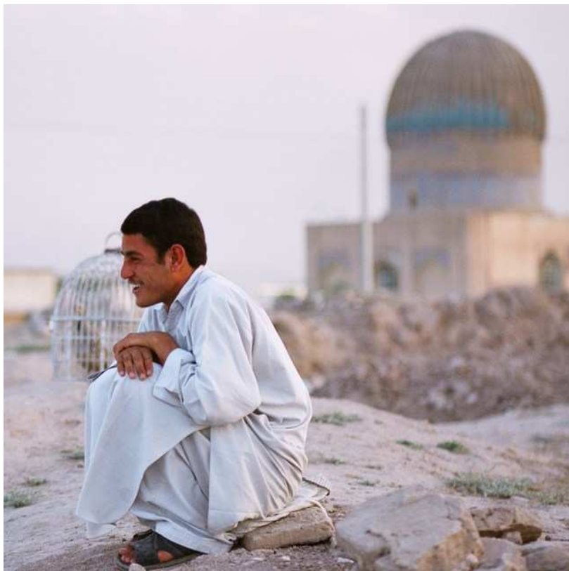
Un jeune homme accroupi devant le mausolée de la reine Gawhar Shad, à Hérat, où le patrimoine est en très mauvais état.