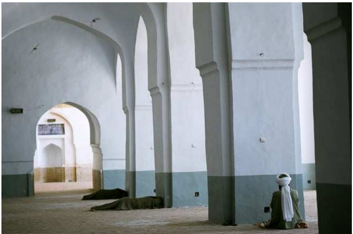
Mosquée d'Herat Masjidi Jami, où certains dorment dans des couvertures tandis que d'autres prient et que les hirondelles tournent.