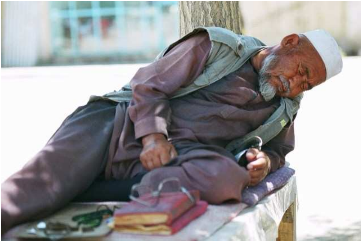
Vieux vendeur de rue endormi, Bamiyan.