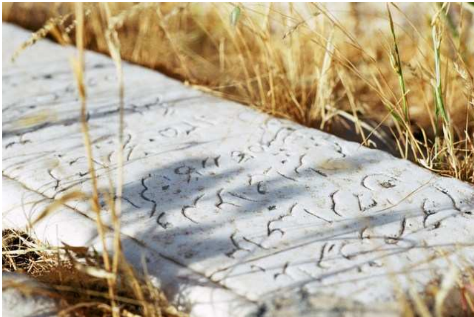
Tombe, Khwajah Abdullah Ansari, lieu de pèlerinage sunnite soufi, Hérat.