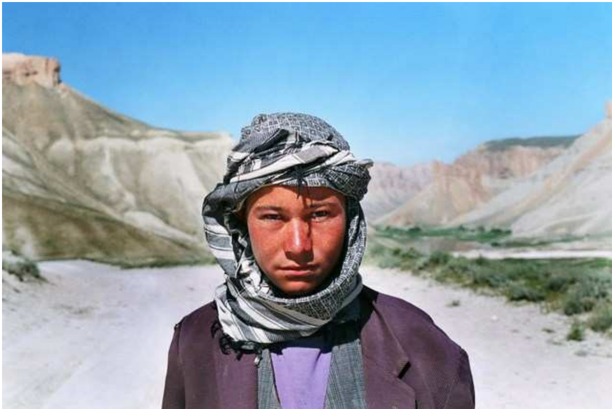
Un des lacs de Band-e-Amir et un jeune berger de la région, qui rêve de partir à l'étranger.