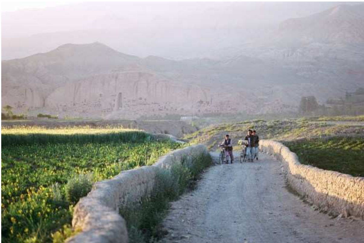
De jeunes gens avec leurs vélos fleuris et au loin, les collines creusées de Bamiyan.