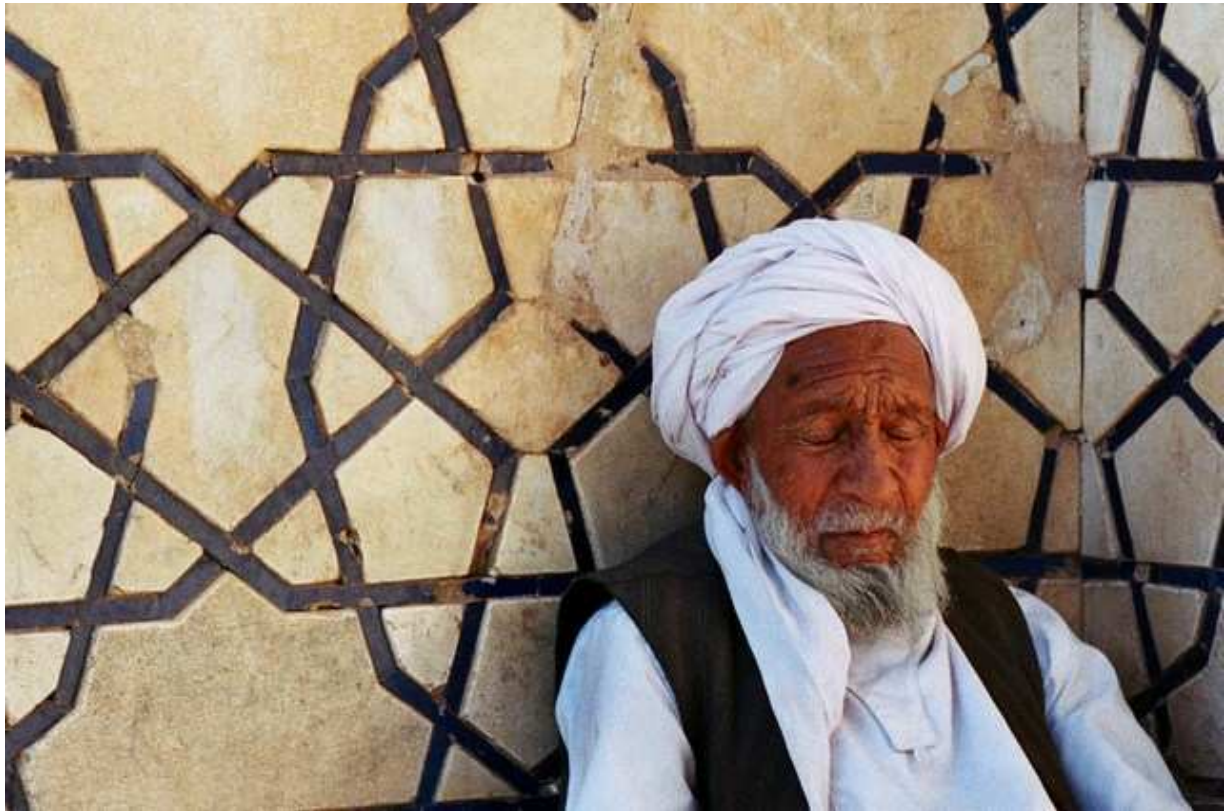
Un vieil homme soufi en recueillement, à Hérat, tombeau du poète soufi Khwajah Abdullah Ansari (XIème siècle), lieu de pèlerinage sunnite soufi.