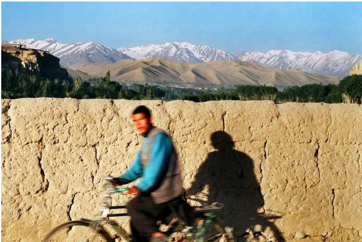
Bamiyan, 7 heures du matin, les hommes vont en vélo au travail.