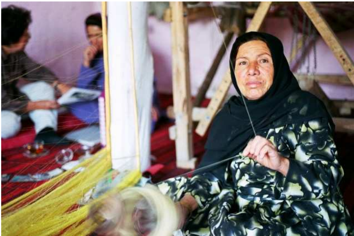
Atelier de tissage créé par l'Ong Artezan, qui réapprend à certaines femmes à tisser la soie.