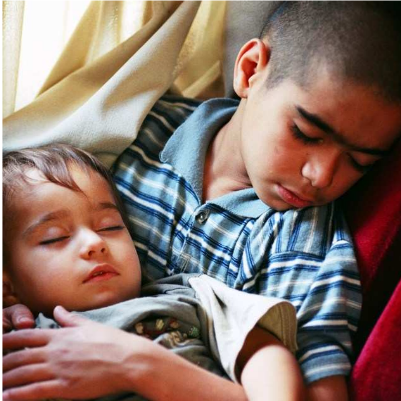
Jeunes enfants dans le bus transfrontalier, allant de Mashad, Iran, à Hérat.