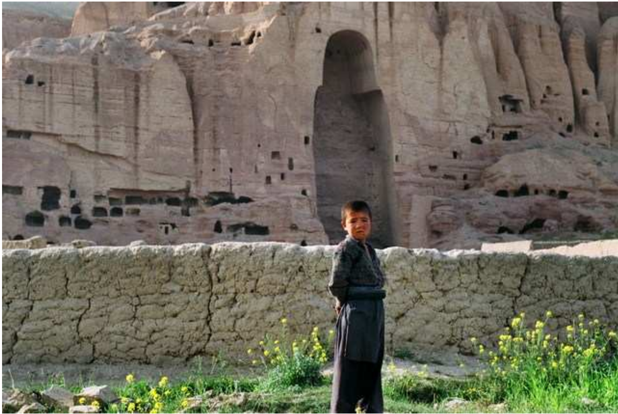
Jeune garçon hazara devant la niche vide du grand bouddha.