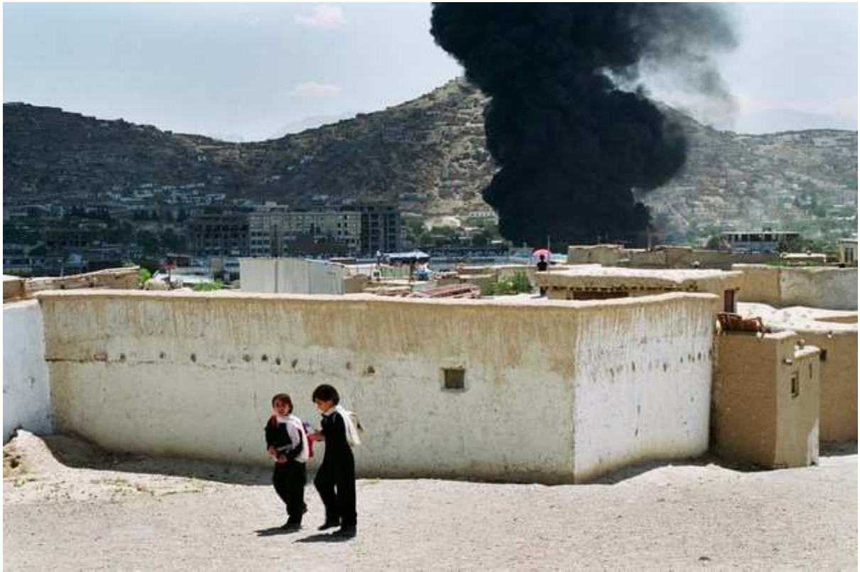
Kaboul, deux écolières passent loin d'un incendie.