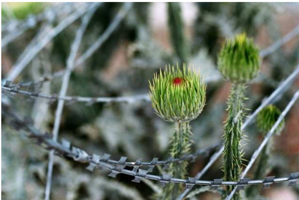
Les barbelés autour de l'ancien palais présidentiel de Darlaman à Kaboul, où poussent les chardons.