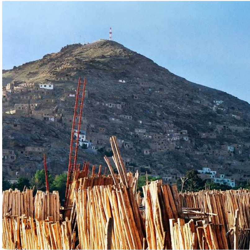
Kaboul en éternelle construction.