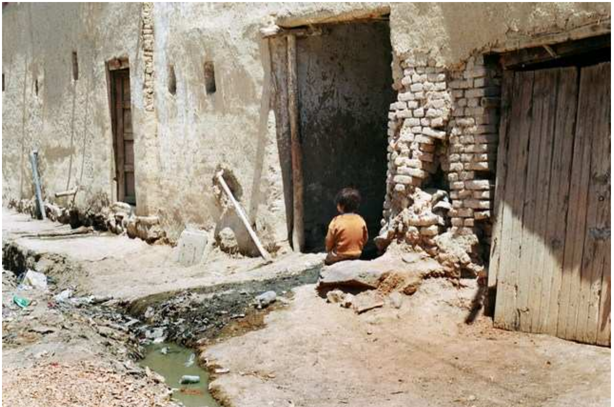
Quartier des potiers, quartier pauvre du centre de Kaboul où les enfants jouent avec les débris dans une odeur pestilentielle.