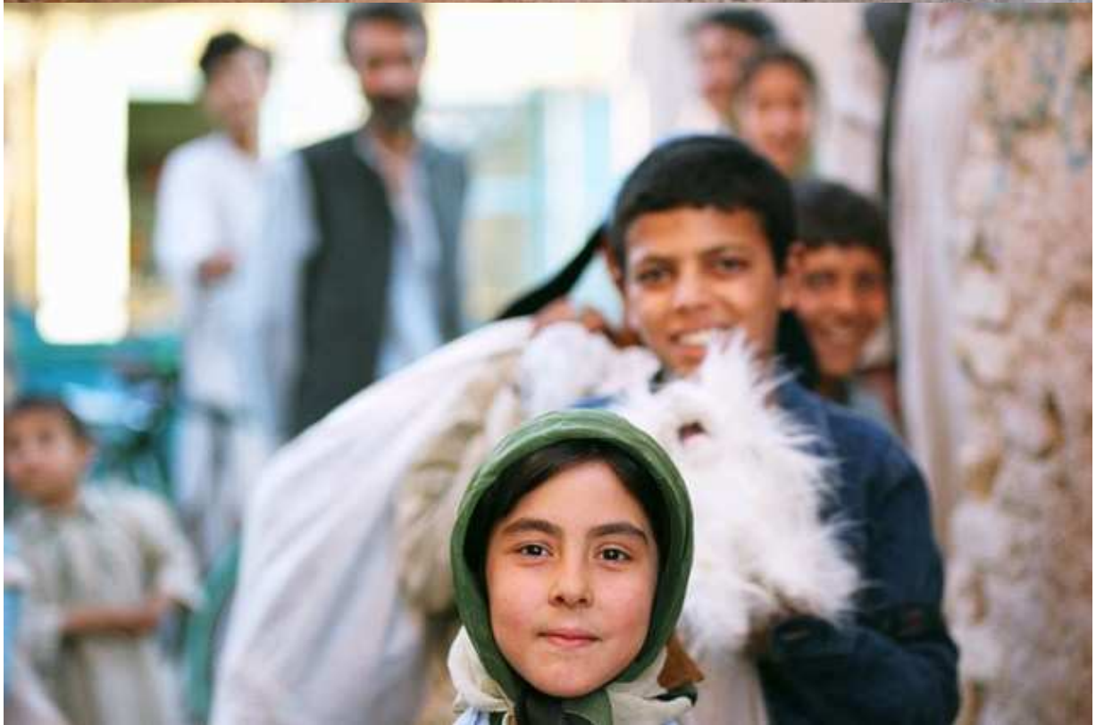
De jeunes enfants courant dans le bazar d'Herat. (murs de la vieille ville en pisé)